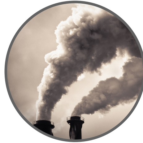
Contaminación de aire