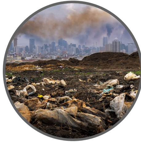
Contaminación del suelo