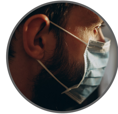
Daños a la salud pública