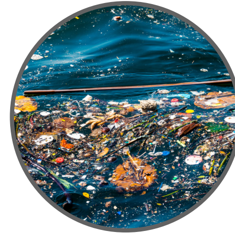
Contaminación del agua